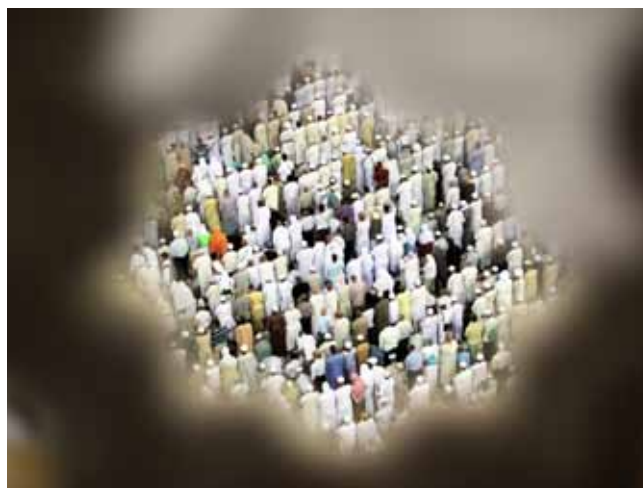
مکه مکرمه - مسجد الحرام